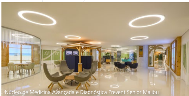
Núcleo de Medicina Avançada e Diagnóstica Prevent Senior Malibu

Localizada no Shopping Nova América, em Del Castilho, a megaunidade Malibu foi pensada no conceito “one stop shop”, que consiste em concentrar diversos serviços em um único lugar para otimizar o tempo dos beneficiários. Dessa forma, a unidade reúne diversos atendimentos multidisciplinares, exames e procedimentos para que o máximo de necessidades sejam atendidas em um mesmo local.