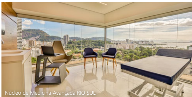
Núcleo de Medicina Avançada RIO SUL

A atuação da Prevent Senior no Rio de Janeiro trouxe um novo conceito sobre tecnologia e inovação no cuidado da saúde e do bem-estar e, desde 2019, segue conquistando a confiança dos cariocas. Hoje, os beneficiários já somam mais de 35 mil vidas.